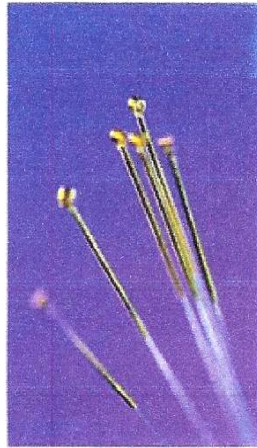
L'acupuncture peut corriger une réaction inadéquate de l'organisme.

Dans une première phase, la personne allergique va tenir dans sa main un tube en verre contenant la substance allergisante. Pendant